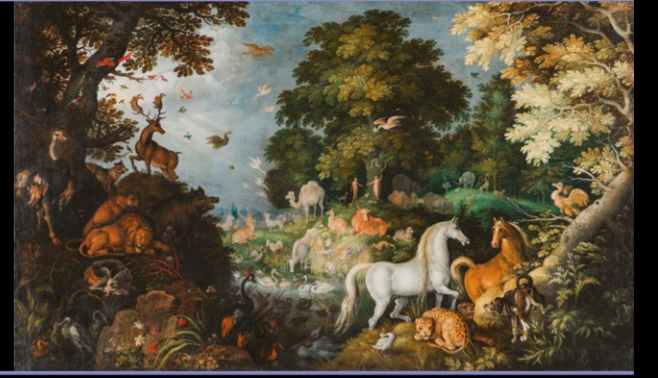
Roelant Savery, Paradies , 1625. GNM.

(Generaldirektor, Germanisches Nationalmuseum)